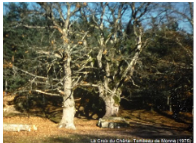
La Croix du Chêne - Tombeau de Monna (1975)

Dans son ouvrage intitulé " La flèche d'or " écrit en 1916, il nous emmène au cœur de l'invasion des Baltes qui ravagea l'Europe au 11ème siècle. L'essentiel de l'histoire se passe dans la région, et, une jeune fille sarazine nommée Monna en est l'une des héroïne. Lorsque Monna décède, ses compagnons l'inhumèrent sous le rocher de la Croix du Chêne.